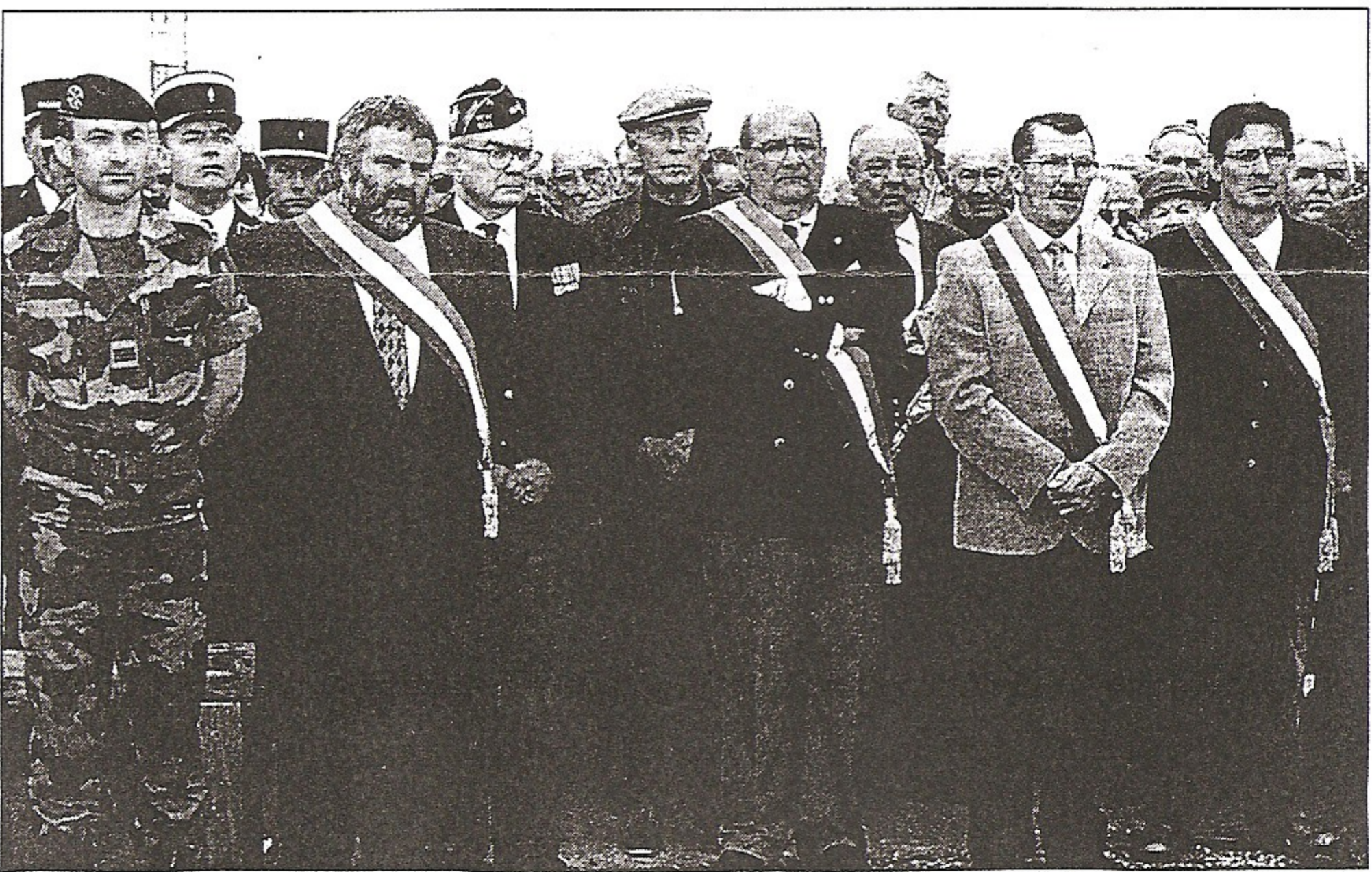
Des invités américains qui ont participé avec émotion, à ce grand moment du souvenir.

À 15 h 30, le 28 juin 1943, des vombrissements se font entendre dans le ciel ilien, une escadrille d'avions américains revient d'un bombardement sur Saint-Nazaire poursuivie par la chasse allemande. Un combat aérien s'engage entre un bombardier, B17 et trois chasseurs de la Luftwaffe. L'un d'eux est abattu, « vraisemblablement par le mitrailleur de queue de la forteresse volante ». Son pilote, dont le parachute ne s'ouvre pas, s'écrase dans un champ près de Borchudan, « il semblerait que les deux autres chasseurs aient été également abattus », précise M. Clément. Néanmoins le grand oiseau d'acier est touché, l'arrière en feu, le B17, volant de plus en plus bas se trouve pris sous le feu des batteries antiaériennes de Kerlan et de Kervellan. Lorsqu'il se trouve à la verticale du Petit-Cosquet, « une partie de l'équipage saute en parachute, tandis que le bombardier vacille et va s'écraser au lieu-dit Bourdan, près de la croix de Keriéro. La chute provoque l'explosion et l'incendie complet de l'appareil ». Cinq membres d'équipage ayant sauté en parachute, atterrissent dans les parages de