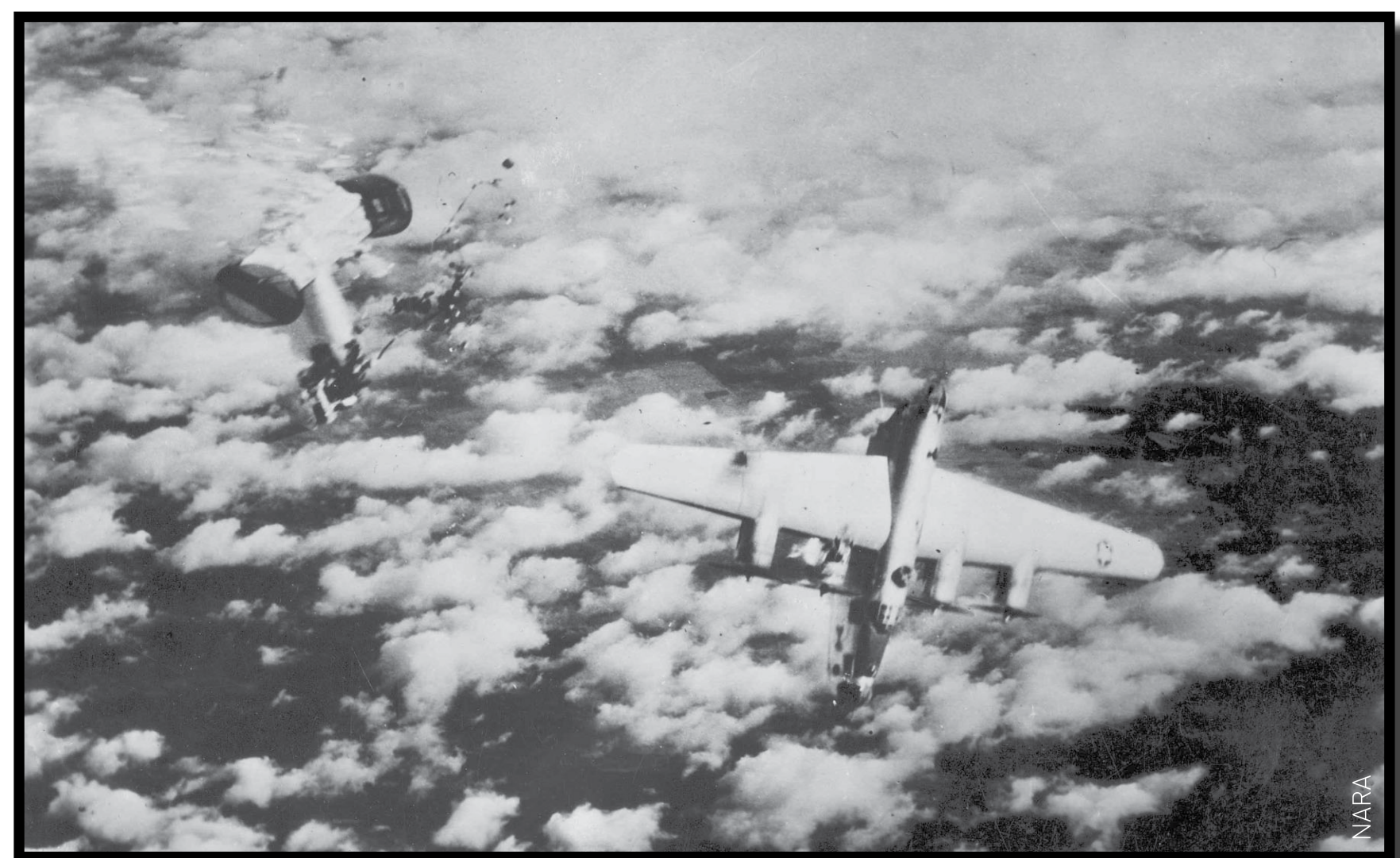
B24 Liberator sectionné en deux