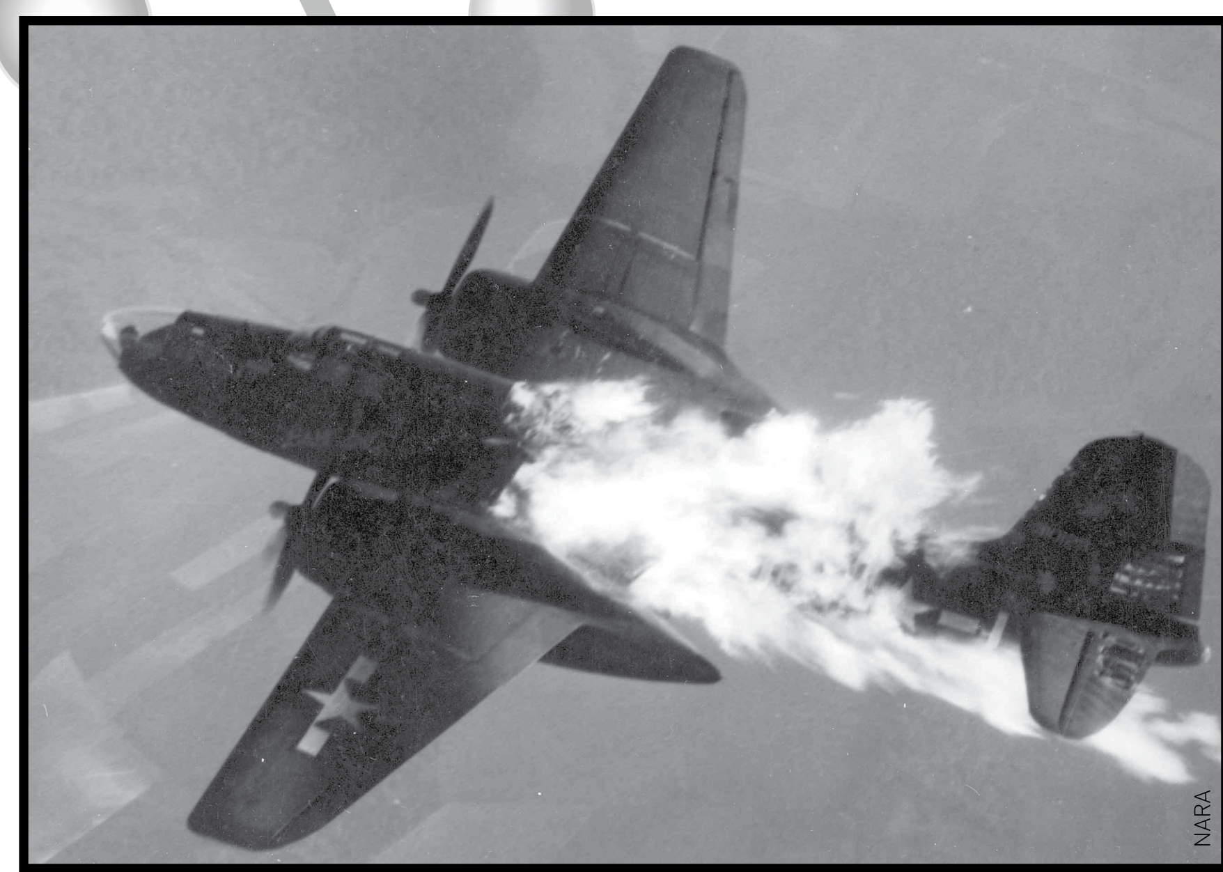
B26 Marauder en flammes