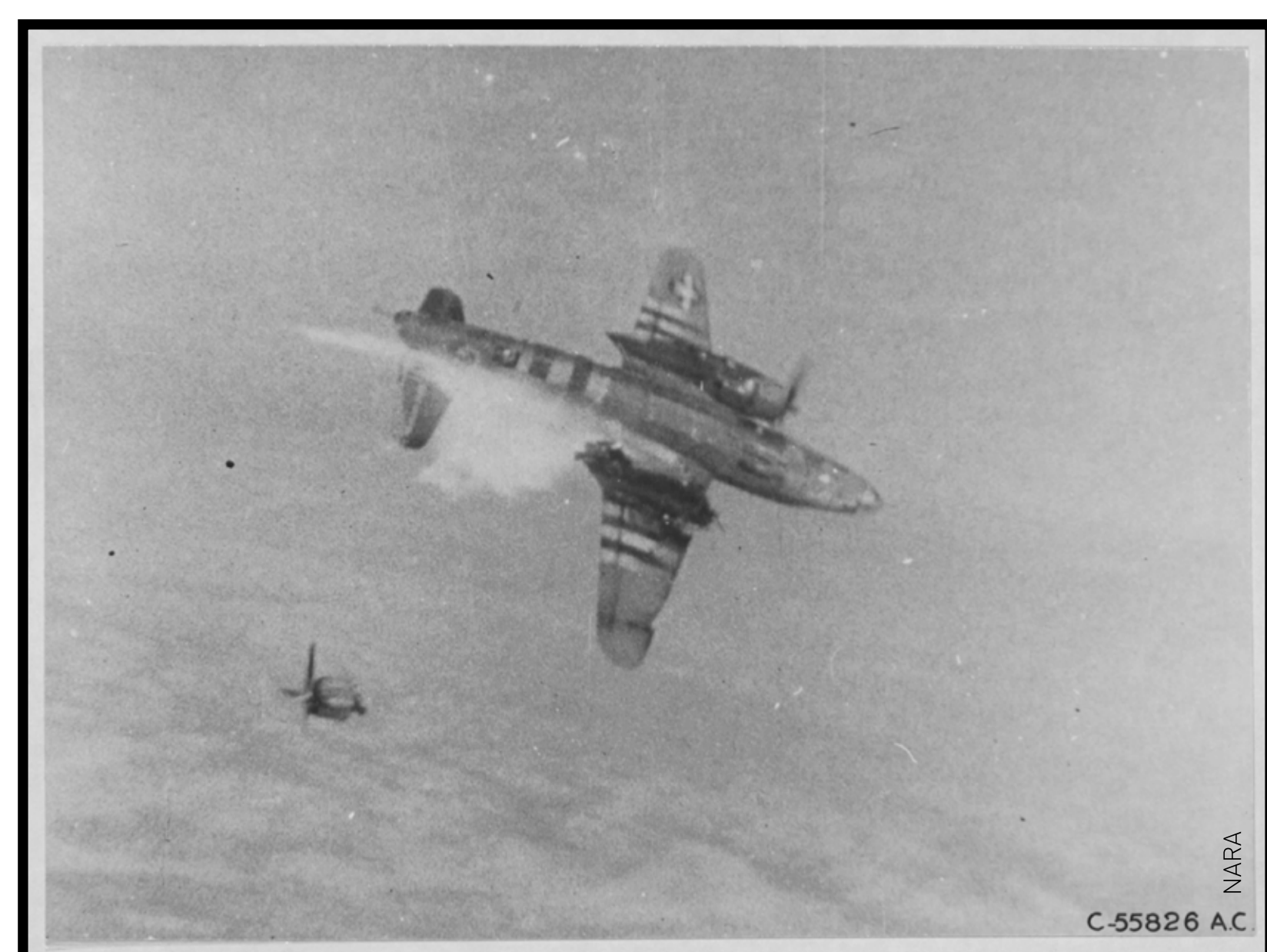
B26 Marauder en perdition ayant perdu un moteur