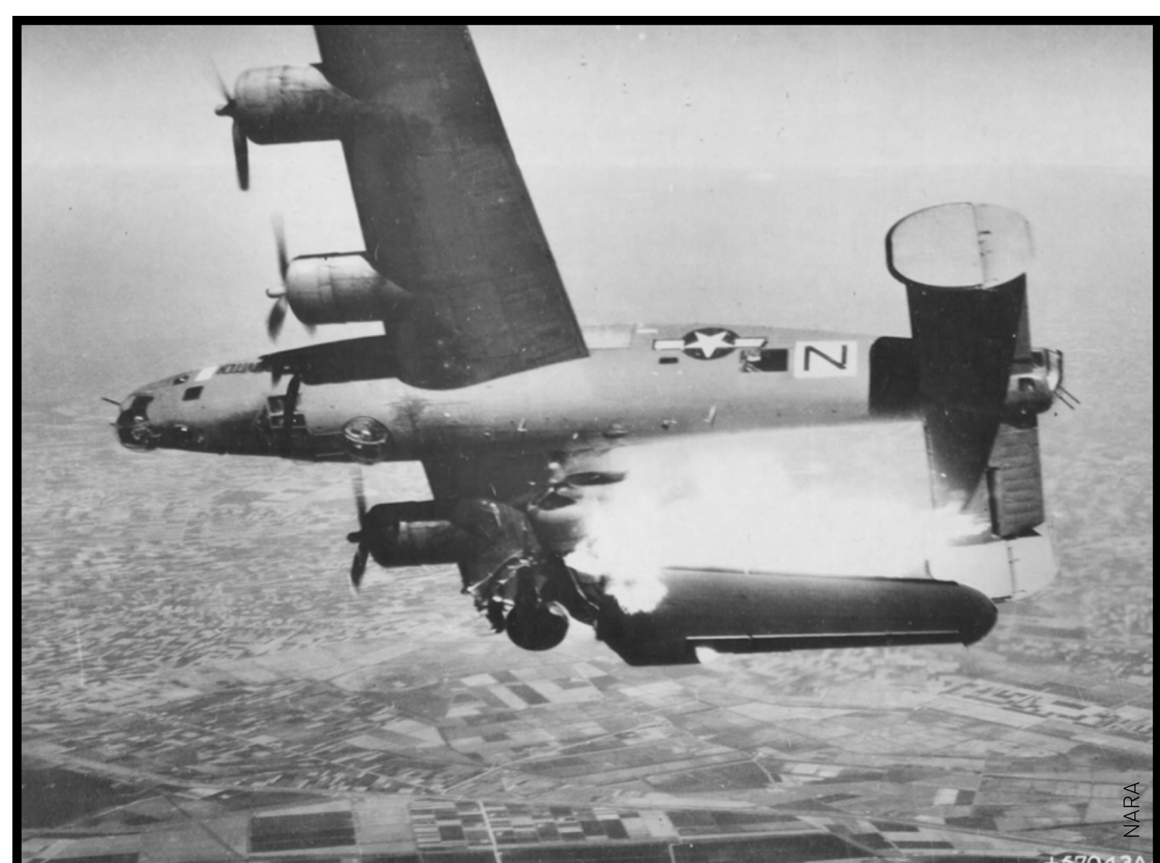
B24 Liberator aile sectionnée et en flammes