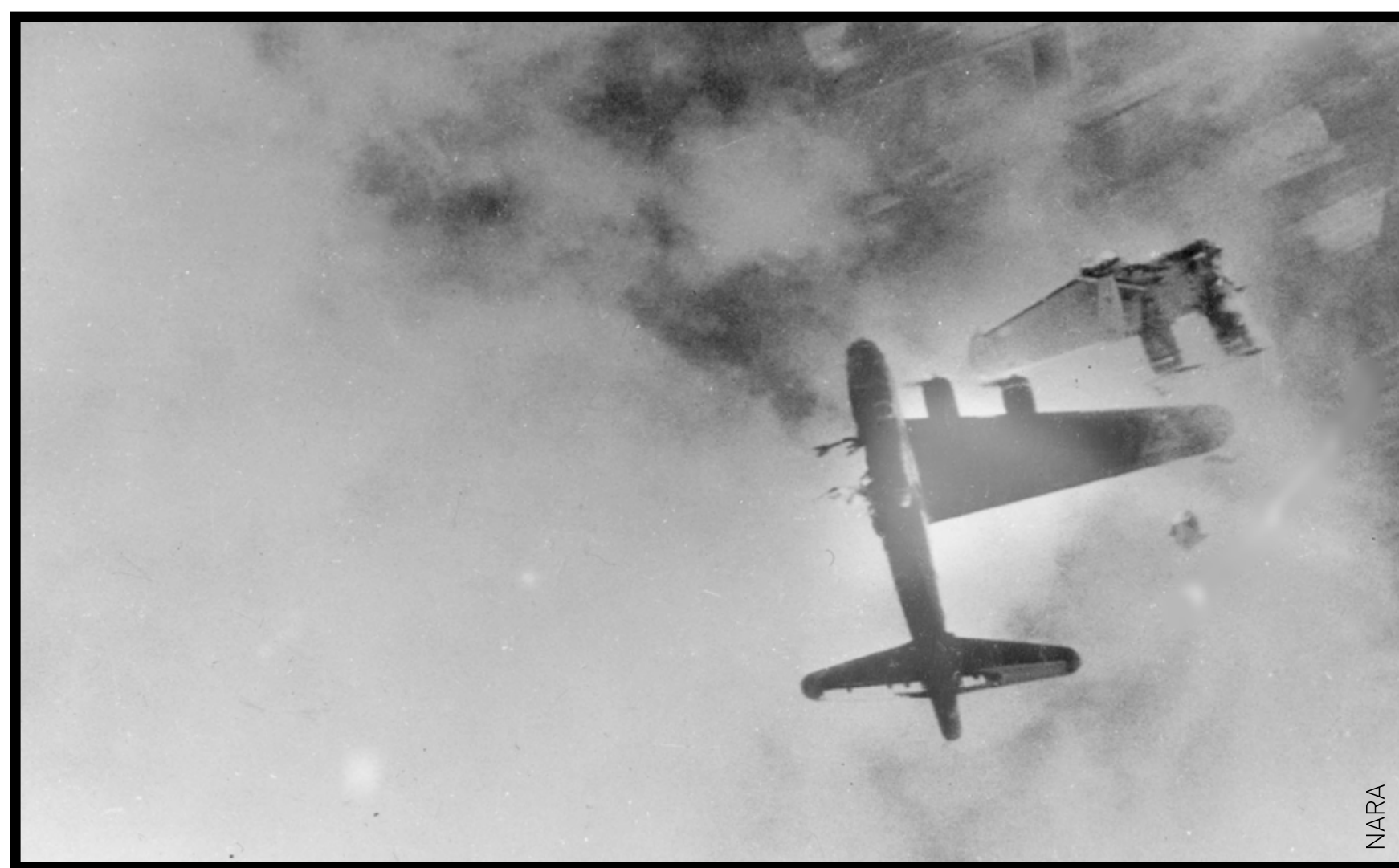
B17 perdant une aile