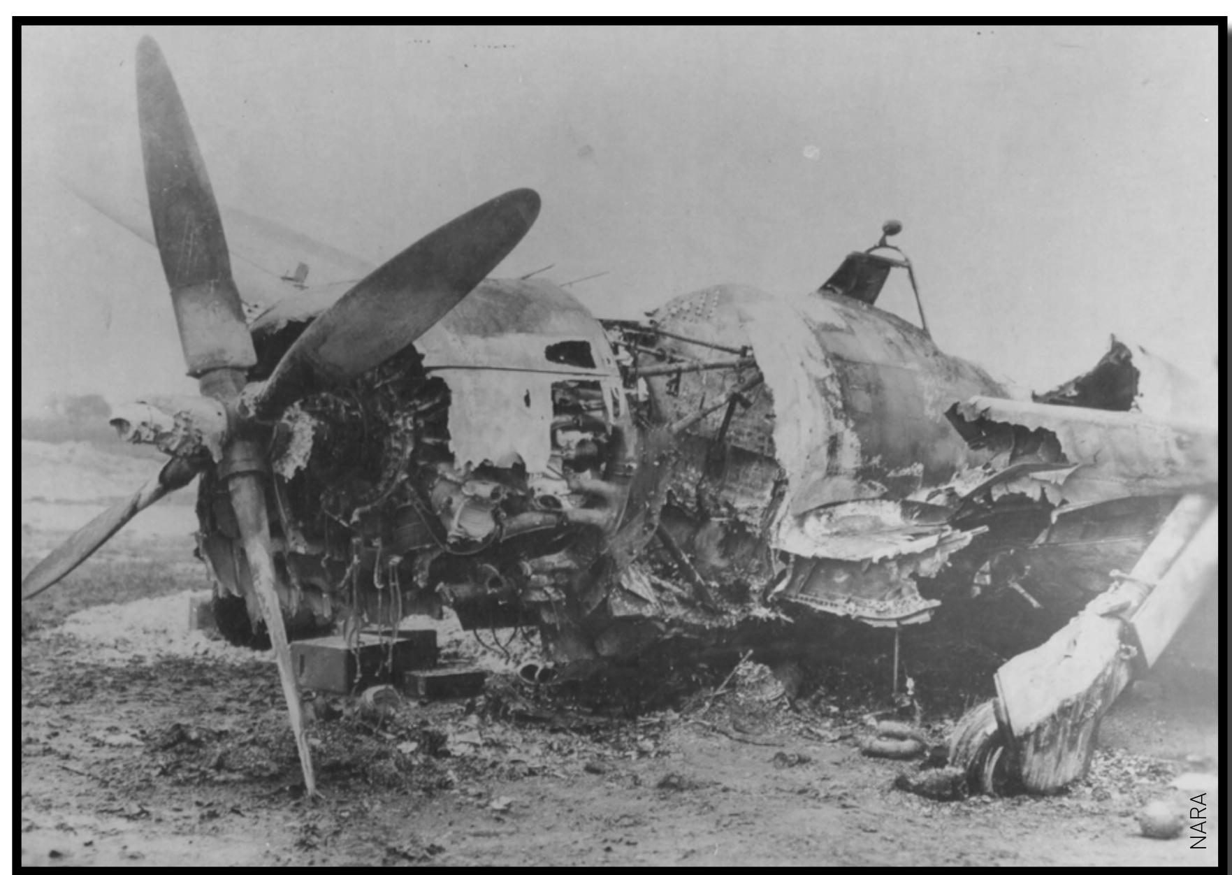
Crash d'un P47 Thunderbolt

A ce chiffre il convient d'ajouter encore les aviateurs parvenus à revenir en Grande-Bretagne mais blessés et décédés des suites de leur blessure.