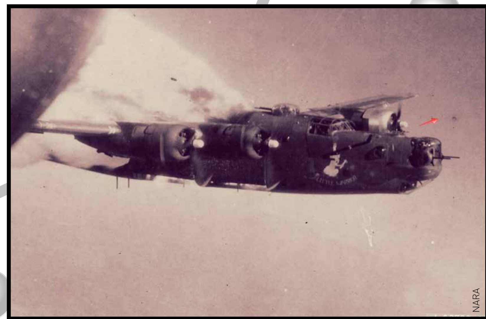
B24 Liberator en flammes