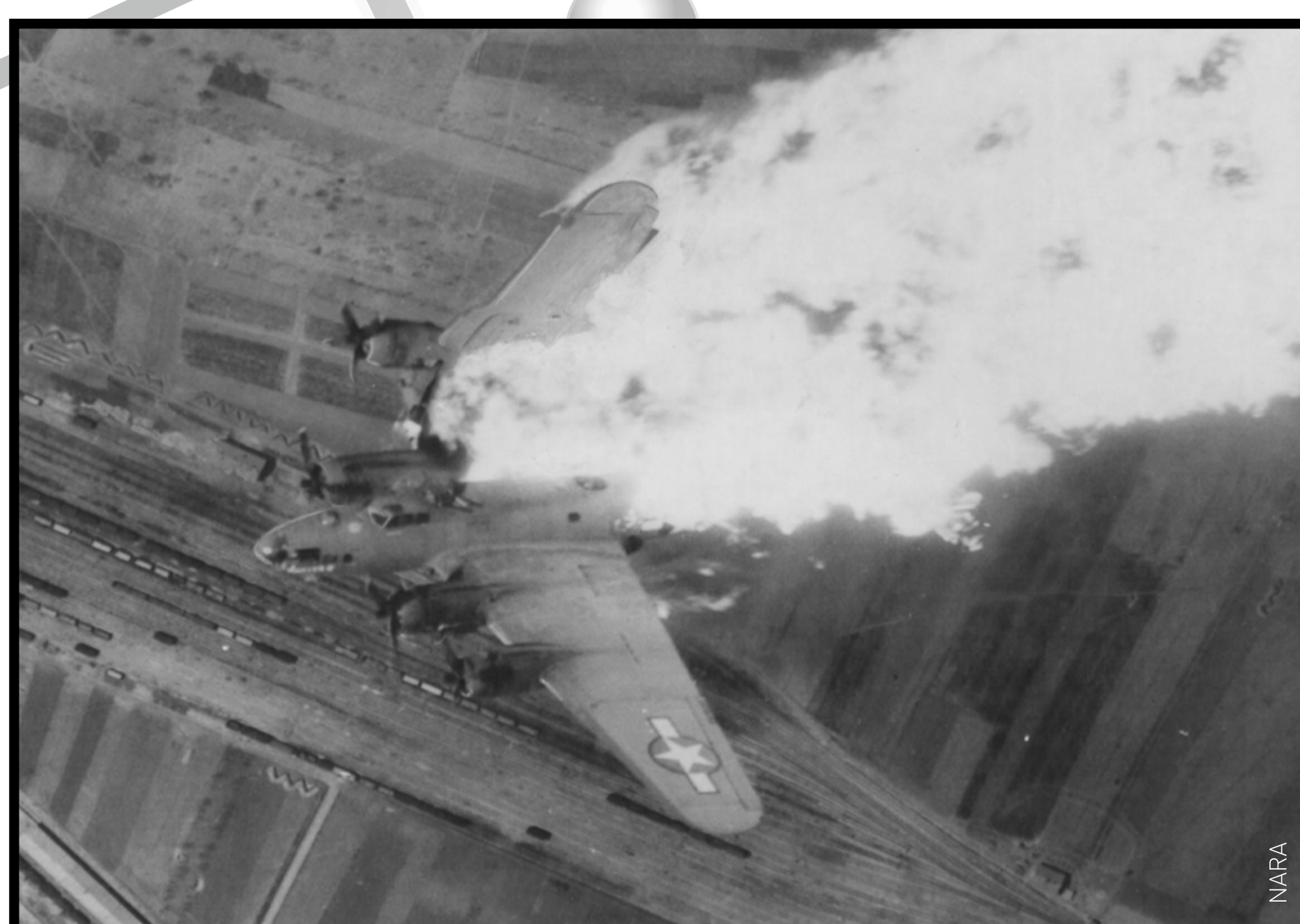
B17 en flamme et perdant son aile